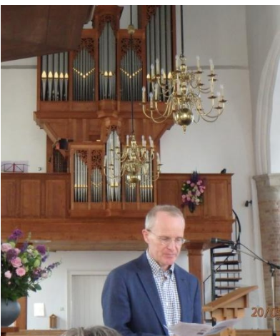
Geen muziek zonder toelichting.

Vanaf het orgel de solist van deze middag