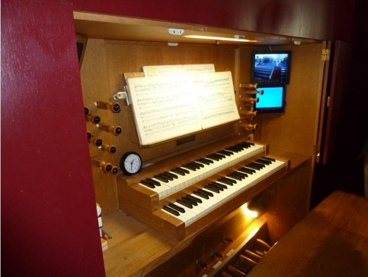
Speeltafel Vredeskerk en pijpwerk.