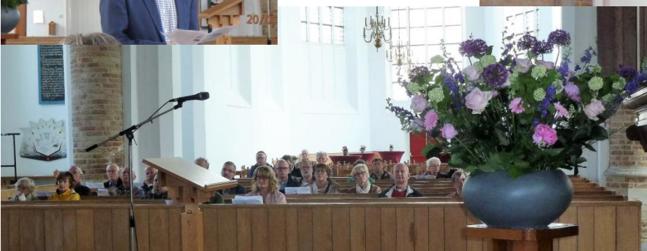
Aandachtig publiek in de Dom kerk