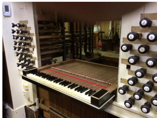
De speeltafel met rugwerkklavier.